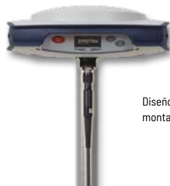
Diseño patentado de antena UHF montada dentro de la mira